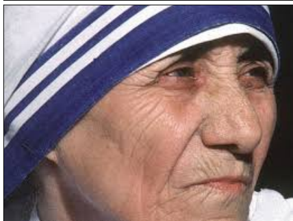
Anna Frank, Victor Frankl y Teresa de Calcuta

en el aquí y ahora , en la comida y la bebida, como en las bodas de Caná, en el paso del Mar Rojo, y en el más allá (la trascendencia) con Cristo presente desde ya y que pasó por Getsemaní , propuesta para la esperanza razonablemente utópica de construir algo positivo para los demás, para los que vienen detrás, para otros que quizás ni veremos.